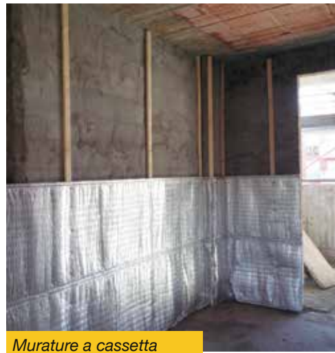
Murature a cassetta